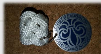
Den treslagna Valknopen