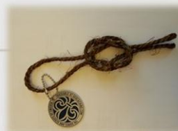
Den Engelska Säckknopen

Det var den första vi lade ut. Den har rest totalt 1107 miles, eller ungefär 177 mil. Den startade på Järvafältet. Ganska snart därefter tog den sig norrut till Luleå. Sen har den kommit tillbaka till Stockholm och påbörjat sin resa söderut. Just nu befinner den sig i de småländska skogarna.