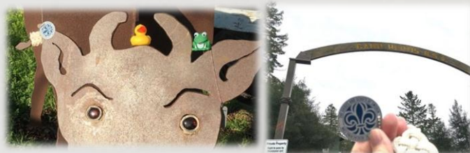
Bilder från Kalifornien

Även denna släpptes på Järvafältet. Den har blivit lite mer berest då den tillryggalagt 10298 miles eller 1647 mil. Efter ett tag så tog den ett skutt ner till Turkiet. Den snurrade runt Istanbul ett tag när den tog sig över Atlanten till Nova Scotia i Kanada. Och gömdes på 4 ställen innan den tog sig tillbaka till trakten runt Istanbul i Turkiet. Den har rört sig längst. Sverige-Turkiet-Kanada-Turkiet-USA. Totalt 17585 miles. Sist någon loggade den var den 27 januari. Då hamnade den vid Barkley i Kalifornien.